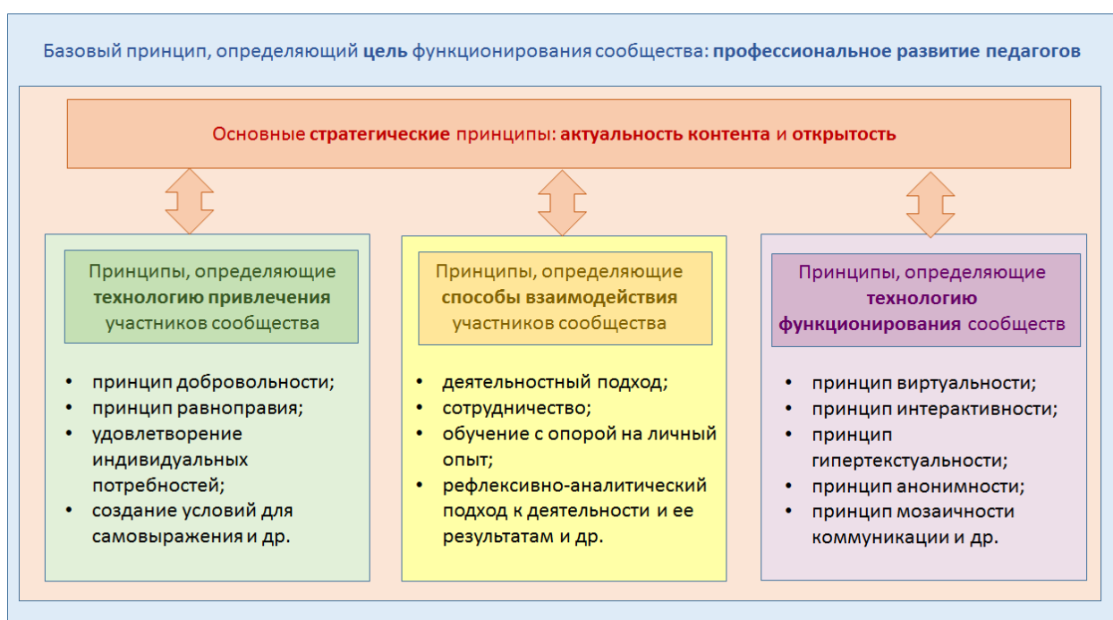
Рисунок 1. Основные принципы развития профессиональных учительских сообществ (объединений учителей)

Достижение поставленных задач обеспечивается реализацией следующих (описанных выше) принципов (рис. 1):