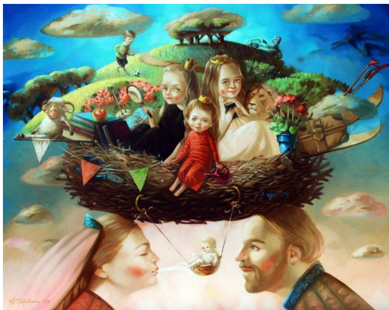
Рис. 1. «Семейное гнездо». Наталья Деревянко

Например, на вебинаре методист показал, как можно провести внеурочное занятие по ценности «крепкая семья». Педагогам было предложено «проиграть» фрагмент занятия. Для начала нужно было поработать с ассоциациями. Участники вебинара на слайде презентации увидели картину (рис. 1), в ней зашифрована ценность, о которой пойдет речь. Специалист предложила ответить на ряд вопросов: «Что на ней изображено? Как Вы думаете, о чем она? Может быть, Вы сможете предположить, как она называется? Почему эта картина так называется?»