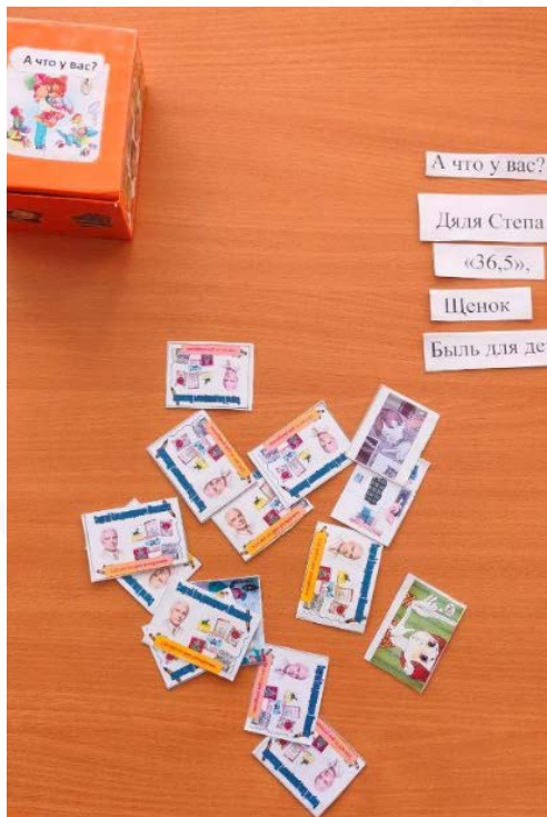
Рис. 3. Лото по произведениям С. Михалкова

Школьники участвовали в интересных творческих конкурсах, посвященных 110-летию Сергея Михалкова (рис. 3, 4). Все работы творческого объединения занимали призовые места.