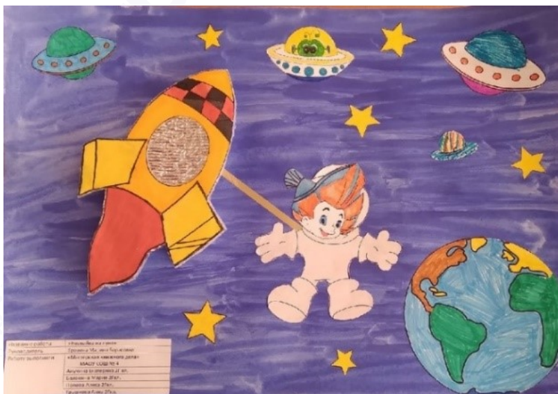
Рис. 1. Объемная аппликация по книге Н. Носова «Незнайка на луне»

В рамках Всероссийской недели детской книги в библиотеке ребята приняли участие в конкурсе рисунков «По страницам книг К. И. Чуковского», приуроченного к юбилейному году писателя. Совместно с детьми было прочитано много книг К. И. Чуковского, после чего ребята творческого объединения изготовили и представили коллективную работу «Чудо-дерево» (рис. 2).