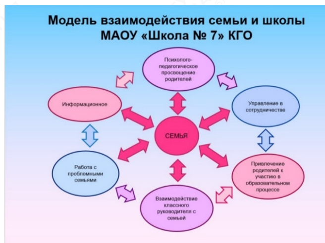
Рис. 1. Модель взаимодействия семьи и школы в MAOU «Школа № 7» КГО

Организованная таким образом деятельность позволила творческой группе педагогов школы создать модель взаимодействия семьи и школы. В ее рамках работа с родителями строится по шести направлениям: психолого-педагогическое просвещение родителей; управление в сотрудничестве; привлечение родителей к участию в образовательном процессе; взаимодействие классного руководителя с семьей; работа с проблемными семьями; информационное (рис. 1). Для каждого направления были выработаны комплексные задачи, определены основные формы работы, спроектированы желаемые результаты, закреплены ответственные, разработаны диагностические карты с показателями и критериями оценки, которые заполняются кураторами направлений два раза в год.