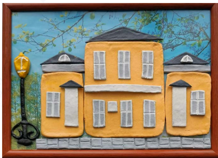
Рис. 6. Картина из соленого теста «Музей П. И. Чайковского»

В 2023-2024 учебном году творческий коллектив «Мастерская книжного дела» принял участие в муниципальном конкурсе на лучший педагогический проект «Мой край, люблю тебя, горжусь тобой!» по гражданскому и духовно-нравственному направлению с темой «МОЯ МАЛАЯ РОДИНА – АЛАПАЕВСК». Целью данного проекта было углубление и расширение знаний о своей малой Родине на основе изучения достопримечательностей города. Вместе с обучающимися и родителями мы собрали материалы о достопримечательностях Алапаевска (музей АУЖД, музей П. И. Чайковского), посетили музеи Алапаевска, библиотеки города, создали фотофильмы о музеях Алапаевска, представили выставку «Все о тебе, любимый город!», на которой были собраны работы детей творческого объединения (рис. 6).