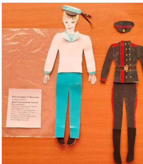
Рис. 4. Макет из бумаги «Дядя Степа»

В рамках Всероссийской недели детской и юношеской книги в Центральной детской библиотеке им. С. Михалкова прошел конкурс на лучший плакат «Хорошей книге – хорошая реклама». Ребята прочитали много интересных книг, кратко описали сюжет и главных героев двух любимых книг и создали рекламу на книги А. Волкова «Волшебник изумрудного города», К. И. Чуковского «Муха-Цокотуха».