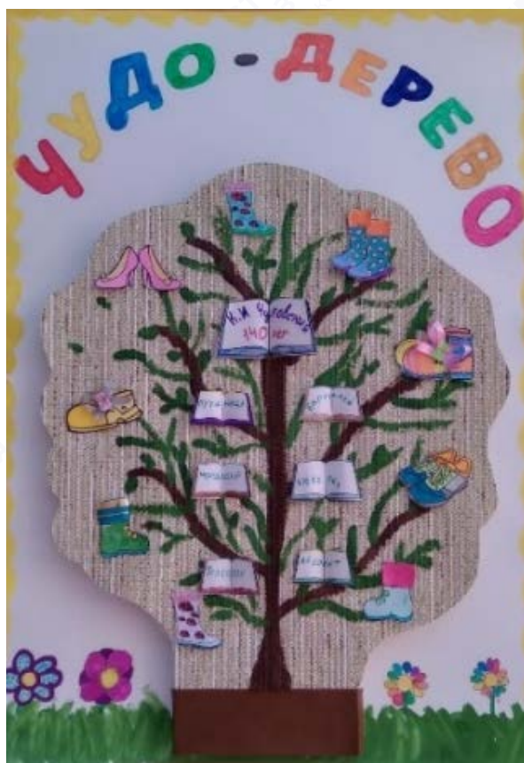
Рис. 2. Коллективная работа по страницам книги К. Чуковского «Чудо-дерево»

В рамках Всероссийской недели детской книги в библиотеке ребята приняли участие в конкурсе рисунков «По страницам книг К. И. Чуковского», приуроченного к юбилейному году писателя. Совместно с детьми было прочитано много книг К. И. Чуковского, после чего ребята творческого объединения изготовили и представили коллективную работу «Чудо-дерево» (рис. 2).