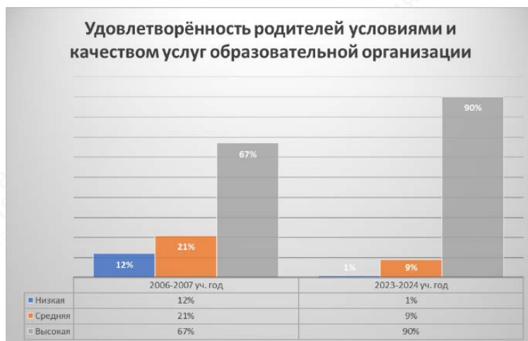
Рис. 3. Удовлетворенность родителей условиями и качеством услуг образовательной организации

Возросла и удовлетворенность родителей условиями и качеством образования. В 2023-2024 учебном году доля родителей с высоким уровнем таковой среди опрошенных составила 90% (рис. 3).