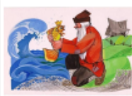
Слайд 3. «Сказки А.С. Пушкина»