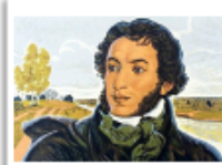
Слайд 1. «Золотые строки Пушкина»

Познакомить родителей с и творчеством Александра Сергеевича Пушкина, подчеркнуть значимость его произведений для воспитания детей, предложить рекомендации по включению поэзии А.С. Пушкина в семейное чтение.