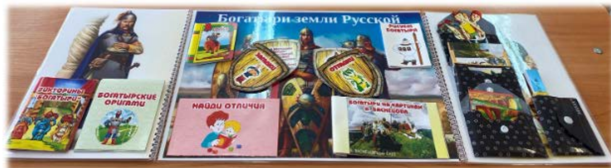
Рис. 2. Лэпбук «Богатыри земли Русской» для уроков окружающего мира и литературного чтения в начальных классах