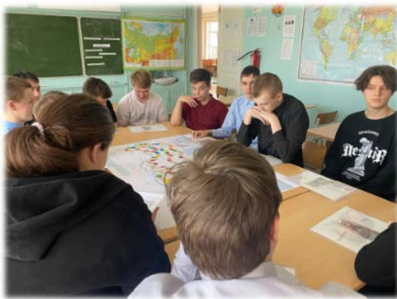
Рис. 4. Дидактическая настольная игра «Российская семья», разработанная в МАОУ СОШ № 12 г. Первоуральска

Традиционно в школе проводятся научно-практические конференции, на которых в рамках деятельности по патриотическому воспитанию обучающиеся представляют исследовательские проекты о родном крае, например, «Памятники и улицы Первоуральска, носящие имена героев России», «Достопримечательности Билимбая», «Колодом», «Исторические достопримечательности Первоуральска», а также «Города-герои», «Карбышевы уроки» и др. Такие проекты позволяют активизировать и поддерживать внимание обучающихся к истории нашей страны, родного края, подвигам героев России.