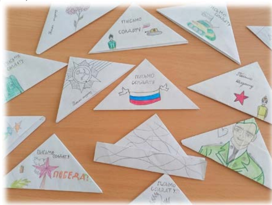
Рис. 1. Письма воинам-участникам специальной военной операции, написанные обучающимися МАОУ СОШ № 12 г. Первоуральска на уроках литературы и ИЗО в рамках реализации мероприятий по патриотическому воспитанию

Традиционно проводятся интегрированные уроки истории и литературы, конкурс сочинений на военную тематику, на уроках литературы и ИЗО обучающиеся пишут и оформляют письма воинам-участникам Специальной военной операции (рис. 1).