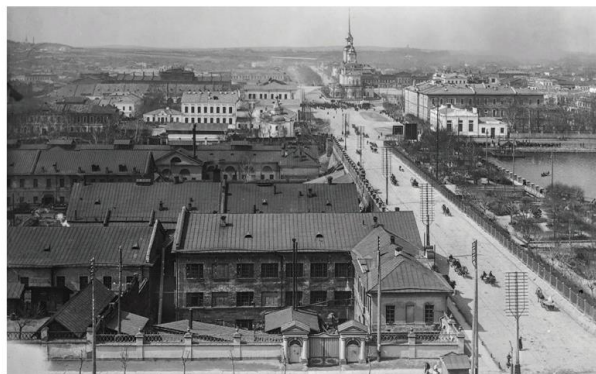
Фотография Главного проспекта с колокольни Екатеринбургского собора

ИРО ИНСТИТУТ РАЗВИТИЯ ОБРАЗОВАНИЯ СВЕРДЛОВСКОЙ ОБЛАСТИ