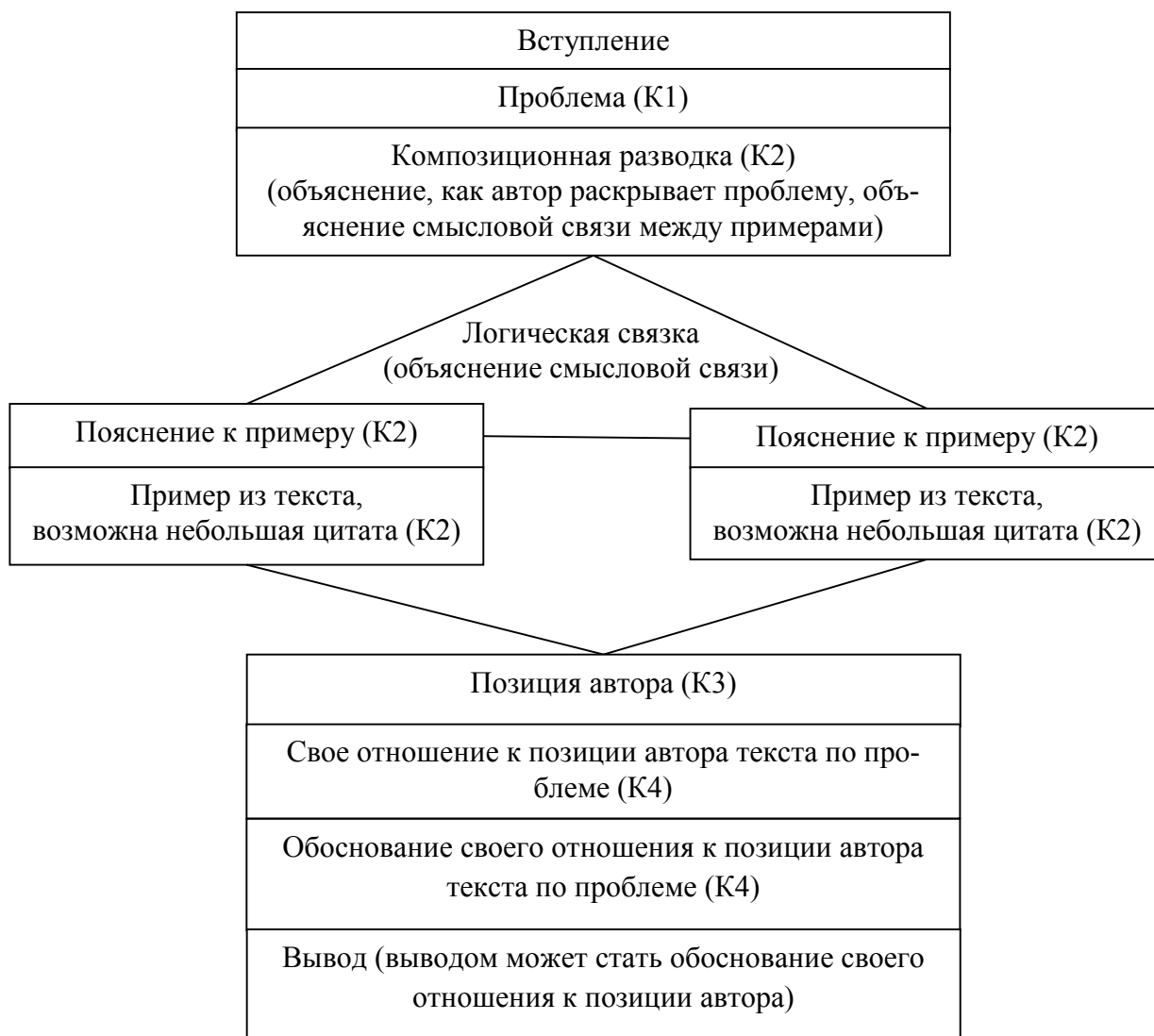
Рис. 3. Схема сочинения