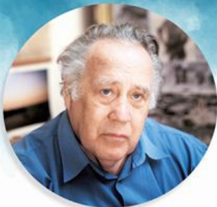
Владислав Петрович Крапивин

Конкурс проводится в целях мотивирования педагогической общественности к изучению литературного и педагогического наследия выдающегося Уральского писателя В.П. Крапивина, а также выявления, поддержки и развития литературных способностей и талантов у детей и молодежи Российской Федерации